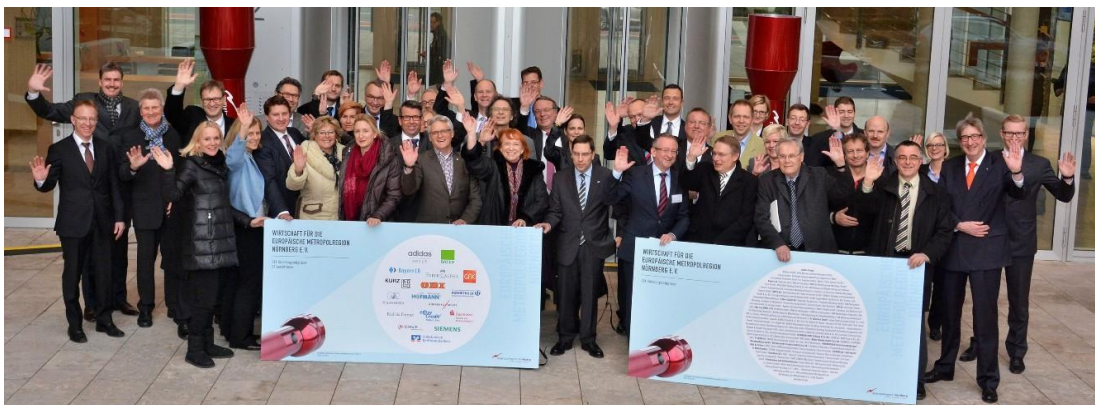
Der Förderverein auf seiner Mitgliederversammlung am 4. Februar 2014

zur Arbeit der Gremien, der Geschäftsstelle, der Fachforen, der Netzwerke und des Fördervereins