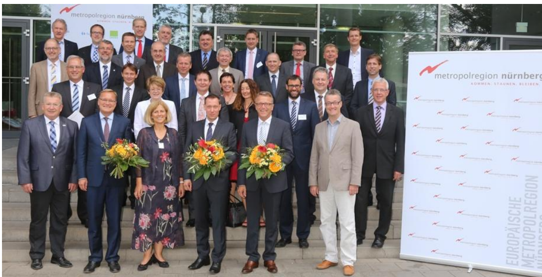
Der neue Rat der Metropolregion auf seiner Sitzung am 25. Juli 2014.