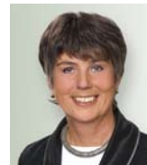
Brigitte Merk-Erbe: Oberbürgermeisterin der Stadt Bayreuth

» Jedes dieser Schilder ist ein selbstbewusstes Bekenntnis der Städte und Landkreise zur Metropolregion Nürnberg. «