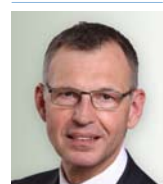
Dirk von Vopelius: Präsident IHK Nürnberg für Mittelfranken

» Dieses einzigartige Projekt symbolisiert und stärkt die Identifikation der Städte und Landkreise mit der Metropolregion Nürnberg. «