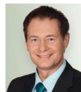
Thomas Thumann: Oberbürgermeister der Stadt Neumarkt

» Die Zusatzschilder dokumentieren für jeden sichtbar, wie weit der Prozess des Zusammenwachsens innerhalb der Metropolregion inzwischen gediehen ist. «